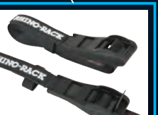
Schnellverschlussgurte In verschiedenen Größen erhältlich