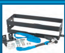
Kanisterhalter In verschiedenen Größen erhältlich