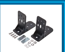
Markisenhalter für Fox- wing oder Sunseeker 50-1631110