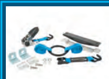
Gasflaschenhalter für 4 Liter Flaschen 50-13RQBH4