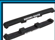
Klettpolster, z.B. für Ski, Snowboard, Kajak, Kanu... 50-1643150