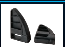
Universalhalter, z.B. für Kajak oder Kanu 50-16RLH2