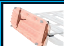
Maxtrax Befestigungskit seitlich 50-1643159