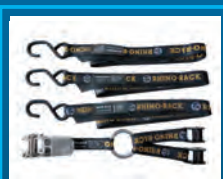
Gurt für Reserverad 50-16RSWS