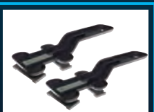
Lampenhalter f. Scheinwerfer 50-1643156 f. LED-Leiste 50-1643173