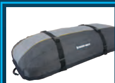
Gepäcktaschen Erhältlich in verschiedenen Größen