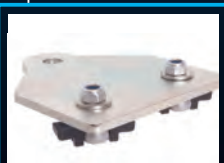
Halter für Arbeits- scheinwerfer 50-13SWLB