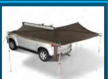
Foxwing Markise links: 50-031100 rechts: 50-031200