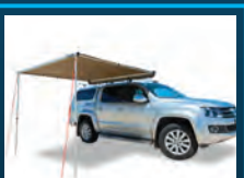
Sunseeker 2,5m Markise 50-032105